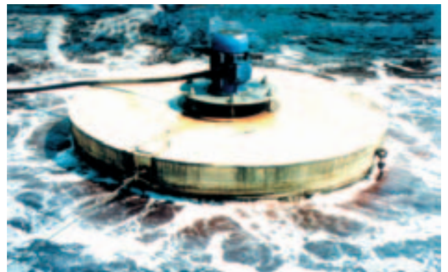
Exemplo de instalação: Tinturaria - 15CV (Cajamar-SP)

Tratamento de águas, esgotos e efluentes industriais