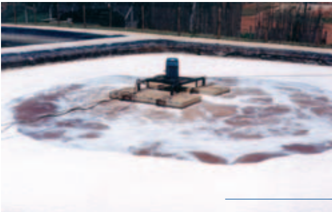
Exemplo de instalação: Lavanderia - 10CV (Indaiatuba-SP)